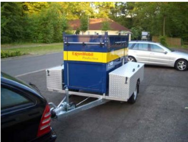
Container auf PKW_Anhänger Fahrgestell als Wechsellader montiert