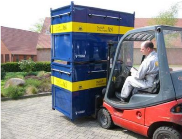
Container sind durch spezielle Halterungen stapelbar