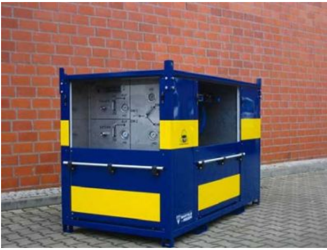
Atenschutz-Container mit Sicherheitskennzeichnung