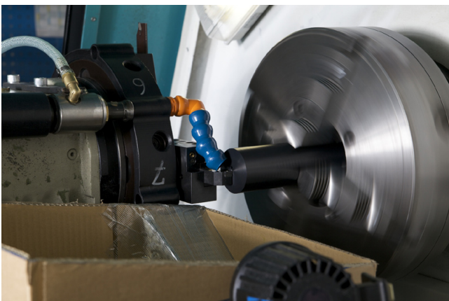
Die ausgeklügelte Absaugvorrichtung im Einsatz an der wechselbaren Werkzeughalterung.