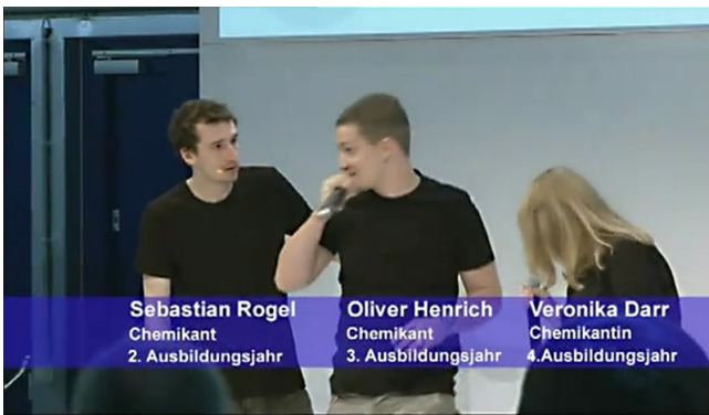
„Sichermacher-Rap“ in Aktion