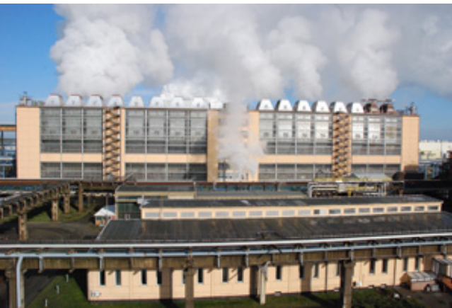
Braunkohlenveredelung Schwarze Pumpe