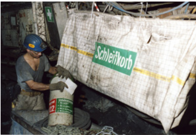
Sicherheitsbeauftragter bei der Kontrolle