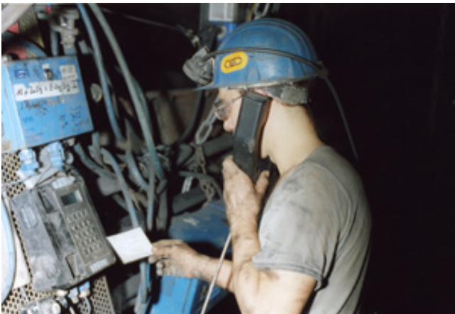
Sicherheitsbeauftragter bei der Meldung