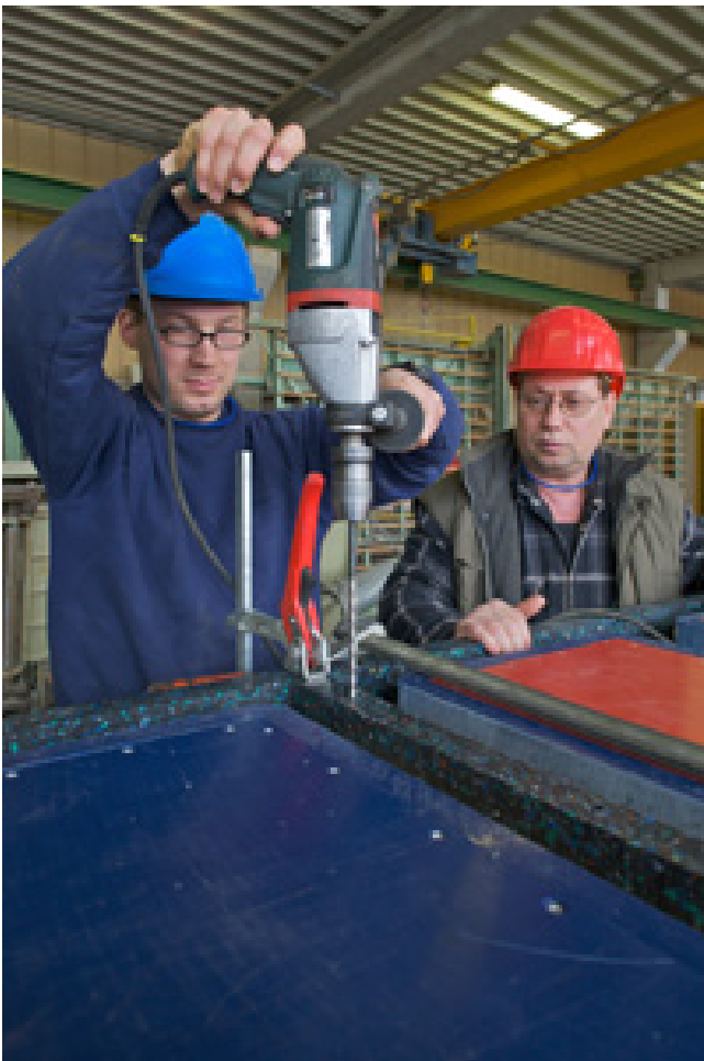
Montage der Form