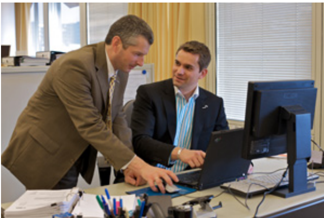
Zur Vorbereitung einer Auslandsreise gehört die detailreiche Information über das Reiseziel.