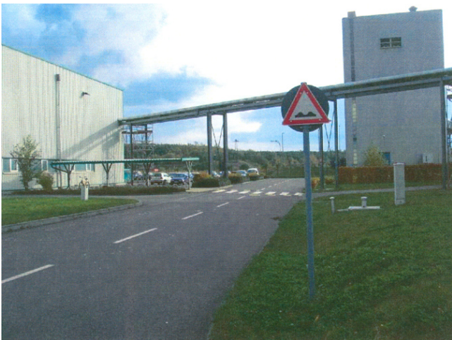
Temposchwellen auf der Silofahrzeugstraße im Kreuzungsbereich Fußgängerüberweg