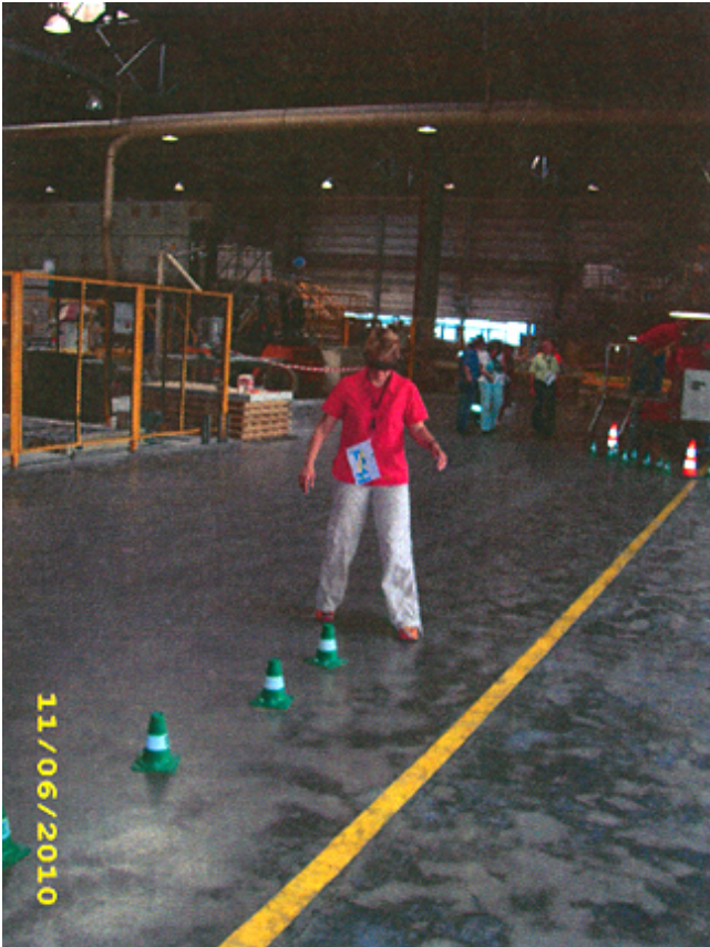
Mit einer Alkoholbrille durch den Parcours