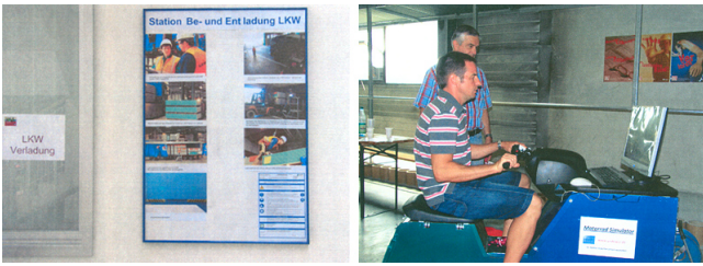
Station: Lkw Verladung / Motorradsimulator