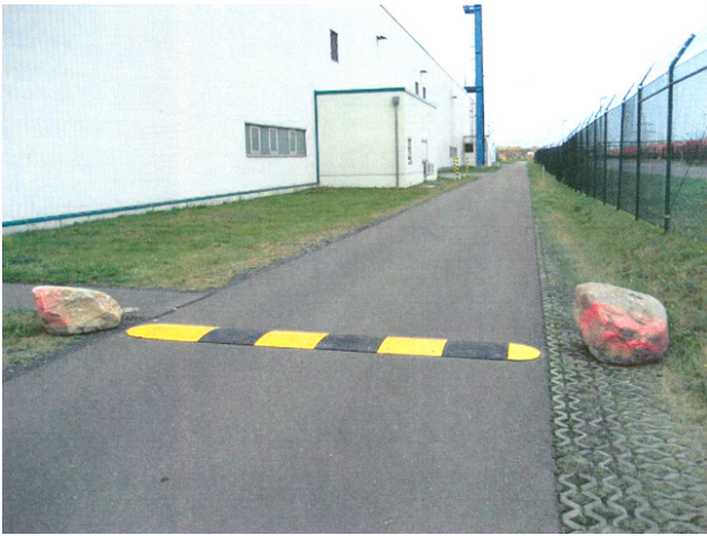
Temposchwellen auf der Umgehungsstraße im Kurvenbereich