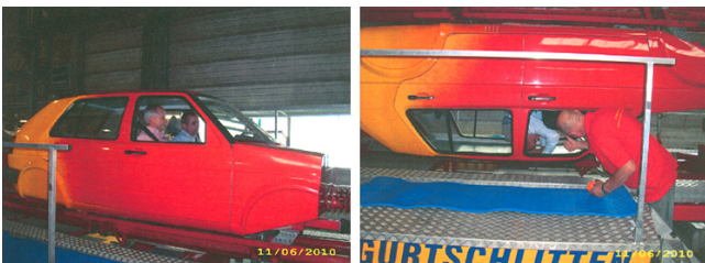
Spezialgurtschlitten - Aufprallunfall und Fahrzeugüberschlag