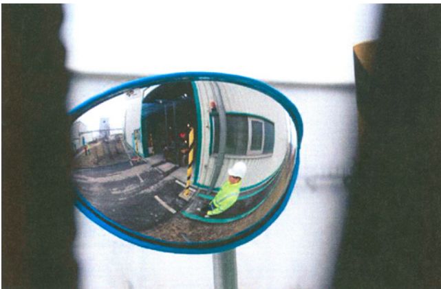
Weitwinkelspiegel im Kreuzungsbereich Fußweg und Rolltore