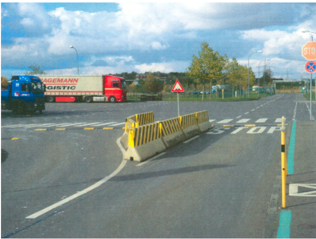
Vorgegebene Verkehrsführung durch Verkehrsinsel im Bereich Lkw-Verladung und Stoppsstraße