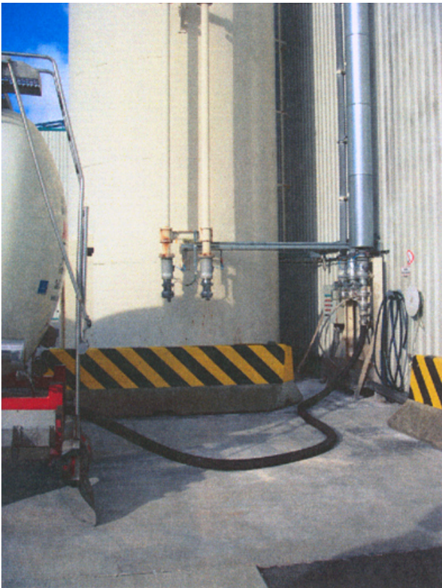
Anfahrerschutz im Bereich Additivanlieferung