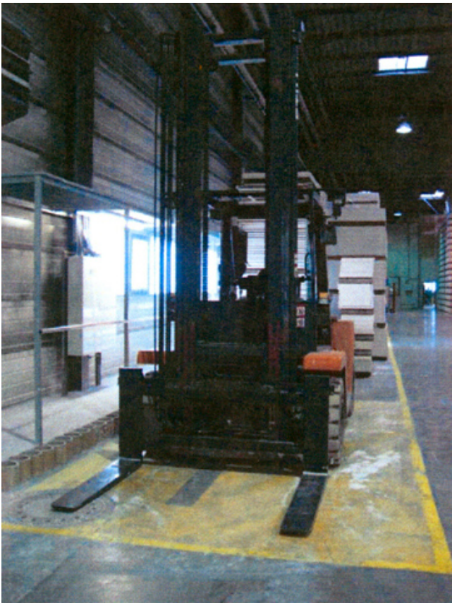
Parkfläche für den Gabelstapler (Produktion)