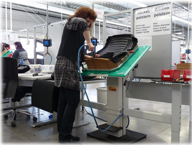
Polstern - heute