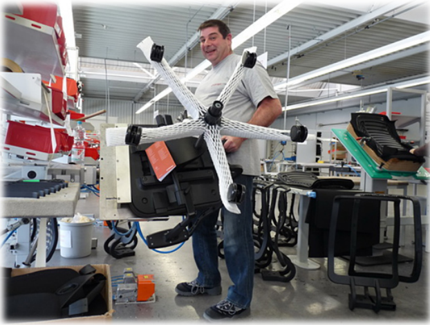
Hohe Belastungen der Mitarbeiter durch schweres Heben und Tragen.