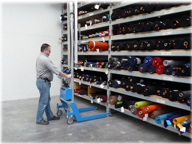
Analyse der Arbeitsabläufe und der einzelnen Arbeitsplätze.