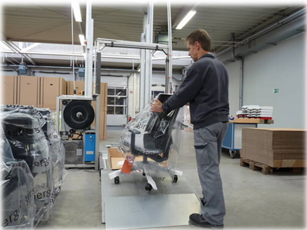
Versand - früher