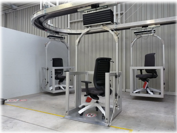
Transportanlage - heute