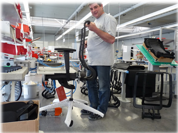
Montieren von Bürostühlen - heute