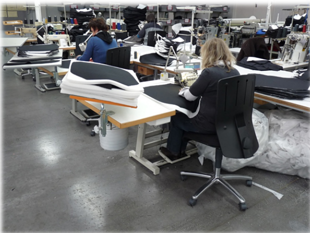
Näharbeitsplätze ergonomisch gestaltet