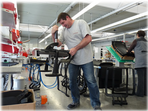
Montieren von Bürostühlen - früher