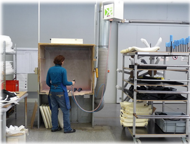
Lösemittelhaltige Klebstoffe durch lösungsmittelfreie Klebstoffe ersetzt