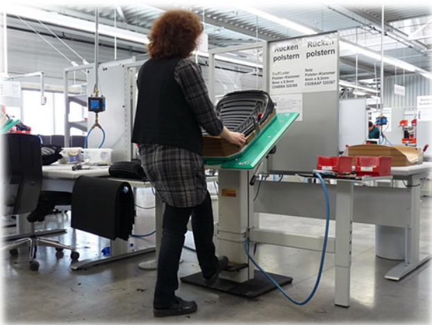
Polstern - früher