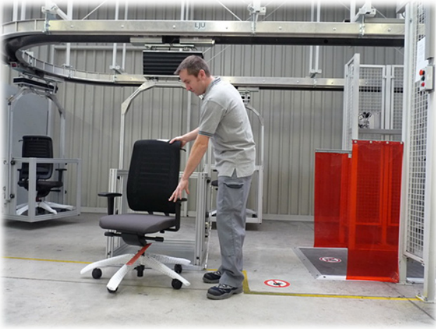
Transportanlage - früher