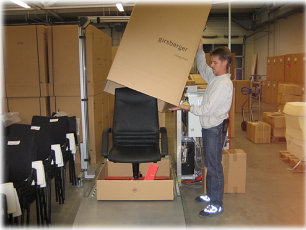
Versand - heute