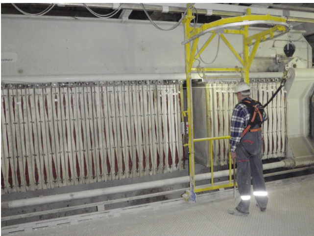
Abb. 6: Der Mitarbeiter schiebt das Gestell von Hand und befindet sich hinter der Schutzbarriere. Das Sicherheitsgeschirr dient als Absturzschutz, wenn der Mitarbeiter sich während des Entleerungsvorgangs der Presse neben das Schiebegerüst bewegen muss.