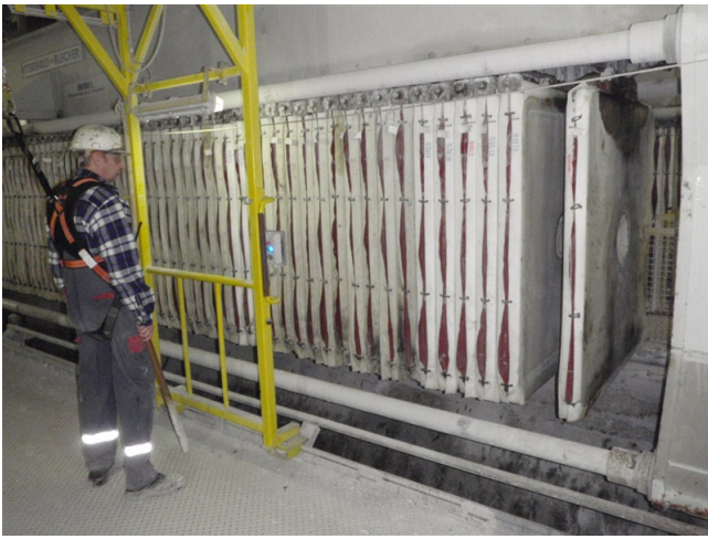
Abb. 4: Der Mitarbeiter positioniert sich hinter dem Schutzgestell