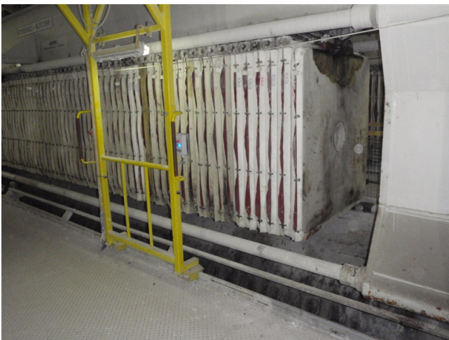
Abb. 3: Das neu entwickelte verfahrbare Schutzgestell neben der offenen Presse