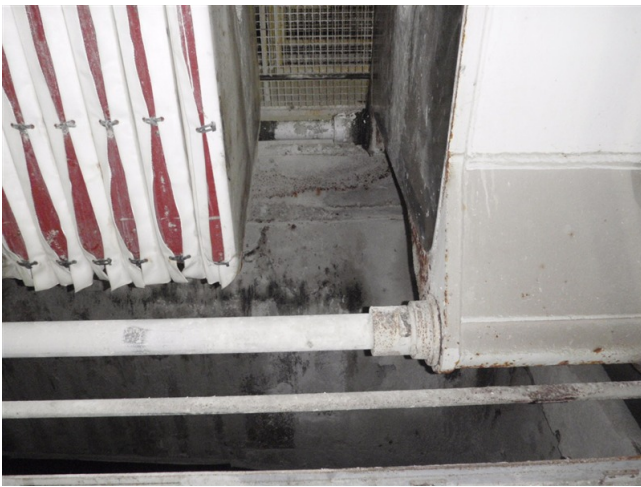
Abb. 2: Ansicht der Absturzmöglichkeit aus der Sicht des Mitarbeiters