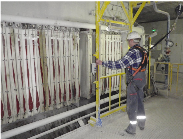
Abb. 5: Die Bedientastatur befindet sich auf beiden Seiten parallel für die Bedienung durch Rechtshänder oder Linkshänder