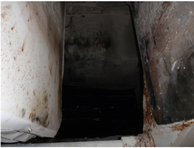
Abb. 1: Mögliche Absturzstelle, ca. 4 m Tiefe