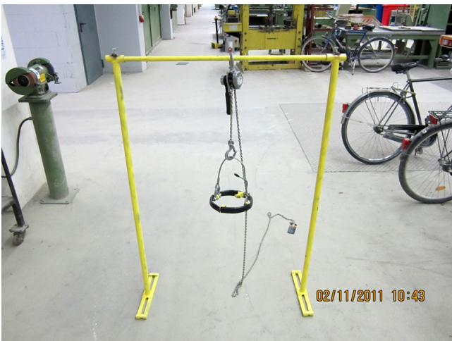
Neue Hebevorrichtung mit Traverse