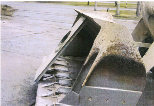
Ohne Erschütterung bleibt die Aufnahmevorrichtung an der Radladerschaufel