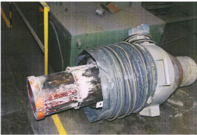
Ausgebauter Rüssel mit seinen Rohrelementen