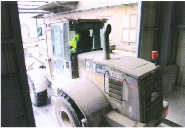
Radlager CAT 28 G - für diesen Radlager wurde die Aufnahmevorrichtung gefertigt