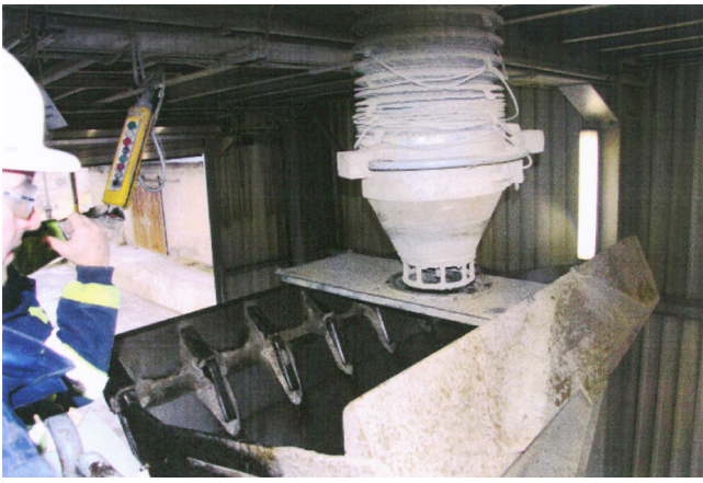
Einführen des Befüllrüssels