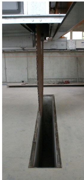
Abdeckung, Wechselschacht; Maschine positionieren