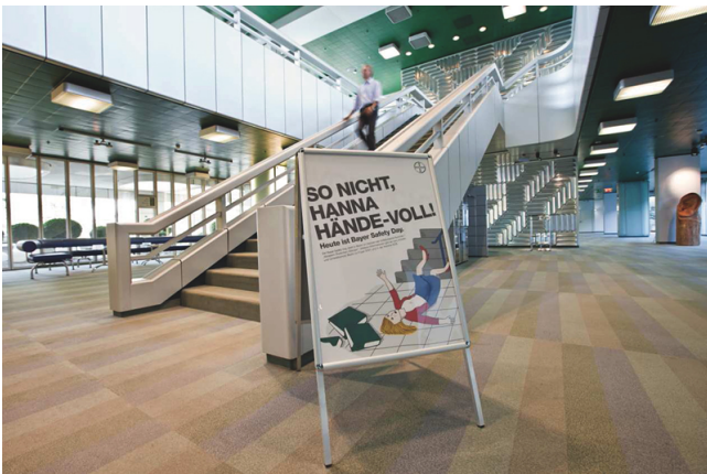
Beispiel eines aufgestellten Plakats