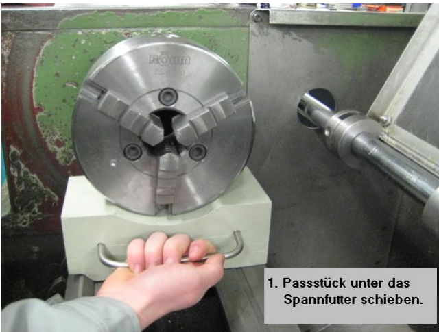
Passstück unter das Spannfutter schieben