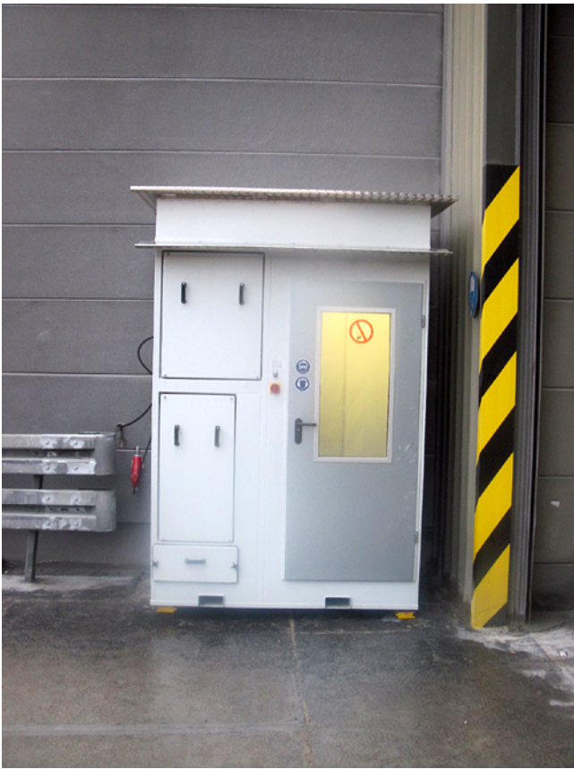
Anschaffung einer Luftdusche