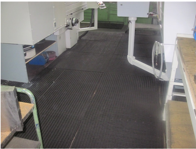
Anti-Ermüdungsmatten für Steharbeitsplätze in der Werkstatt