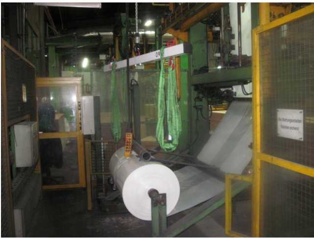
Kran zum Folienwechseln an der Verpackungslinie