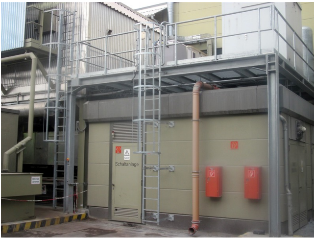
Rückenschutzbügel an Steigleiter