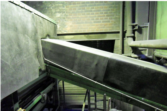
Einhausung der Presse zur Staubreduzierung