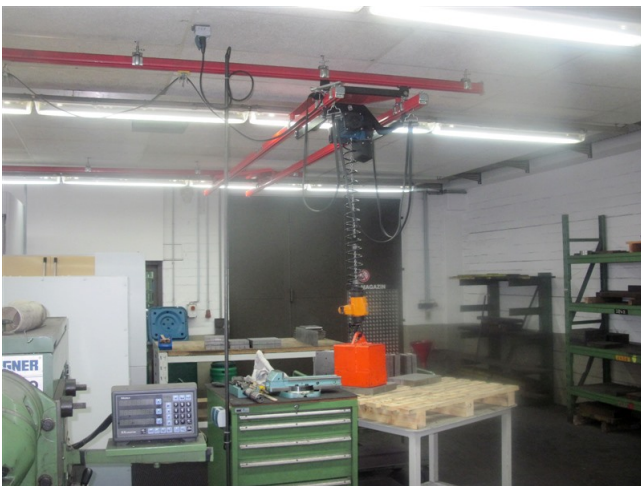
Kranschiene als Hebehilfe für den Formbaukran