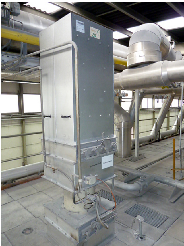
Ofenventilator mit Schalldämpfer