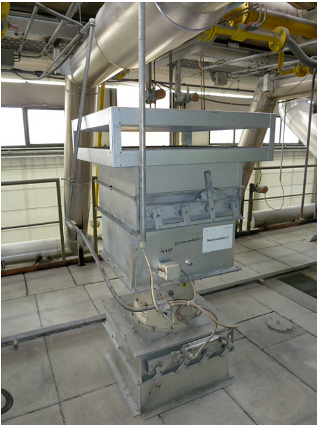
Ofenventilator ohne Schalldämpfer