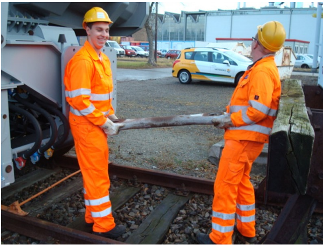
Das Kuppeln der Wagen erfolgt durch zwei Personen