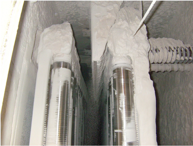
Freifallscheider (alte Lösung)