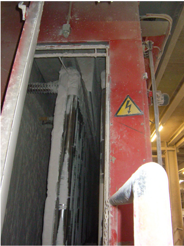
Freifallscheider (alte Lösung)