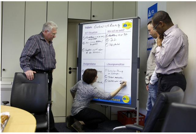
Ausarbeitung von Lösungen