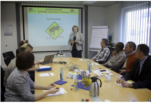
Moderierter Workshop „Gemeinsam gegen Stress“