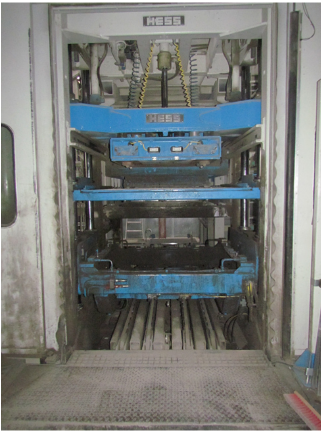
Steinfertiger - Halterung für Rinnenkernform ist ausgebaut