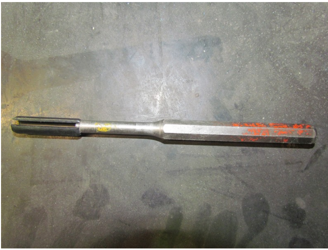
Konventioneller Austreiber mit angesetztem Spannstift