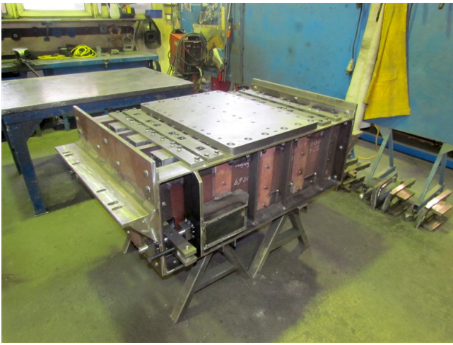
Halterung für Rinnenkernform