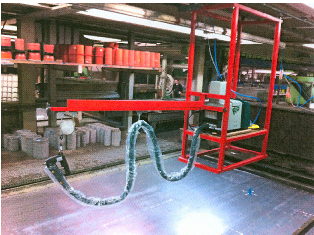
Fertigstellung der Konstruktion