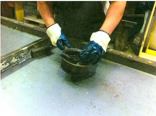
Aufbringen des Klebers