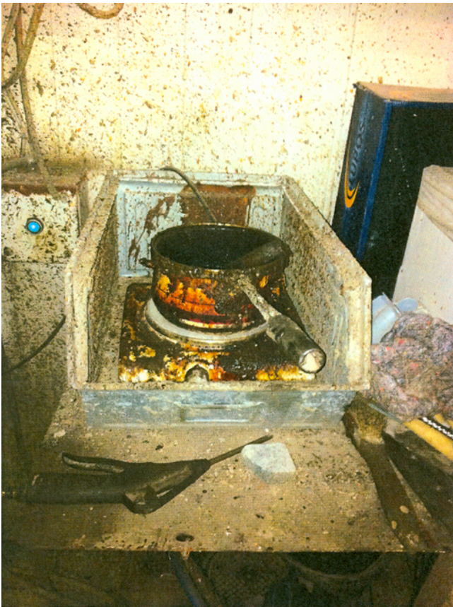
Kleber im Bereich der Zwischenstation