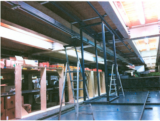
Beginn der Installation 1