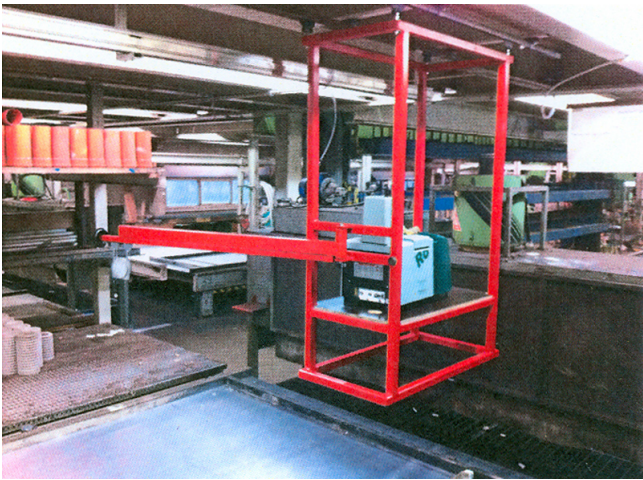
Beginn der Installation 2