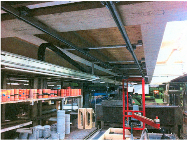
Ansicht Konstruktion unter Decke