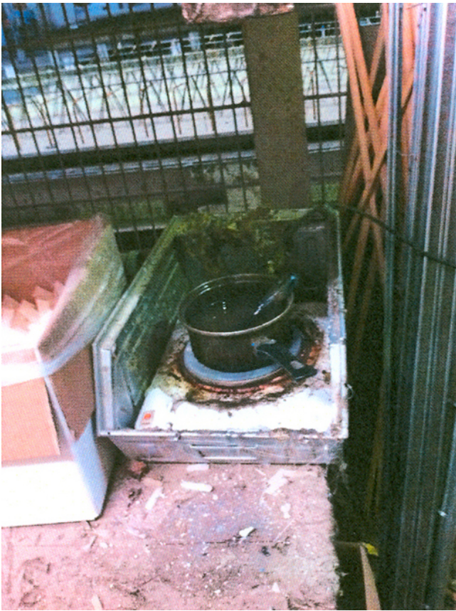
Kleber im Bereich der Plottstation