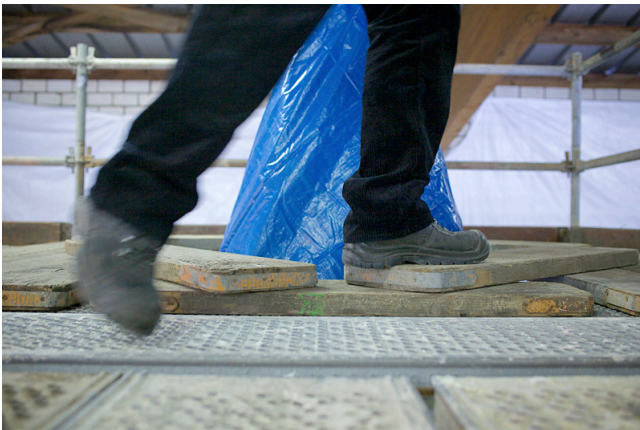
Bisher ein Schwachpunkt beim Einsatz von Systemgerüsten: Bei Aussparungen oder runden Baukörpern werden Bohlen zum Abdecken von Öffnungen eingesetzt.