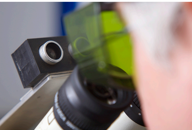
Erhöhte Sicherheit durch zusätzliches Erkennungssystem