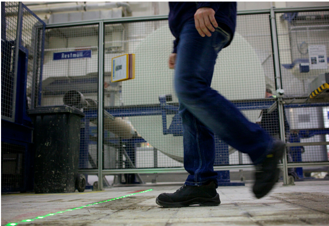
Verblüffend einfach: Die in den Boden eingelassenen LED-Leisten signalisieren deutlich, ob man gehen kann...