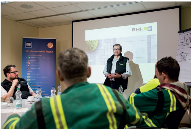
Eine sinnvolle Ergänzung für jede Unterweisung ... die interaktive Übungstafel.