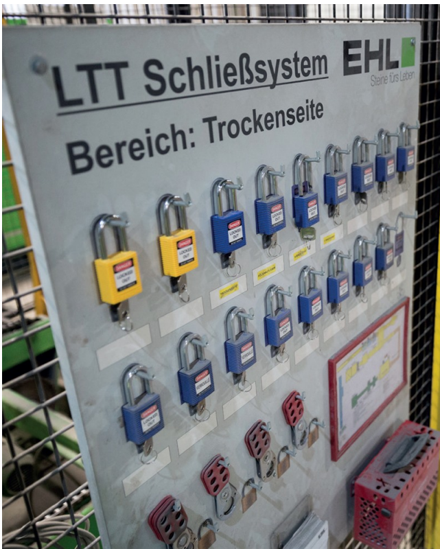
Konsequente Absicherung der Bereiche durch Schlösser.