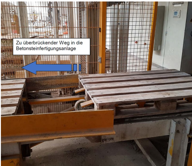
Ende der Kettenförderung - Anfang Übernahme durch Palettenaufnahmeschienen