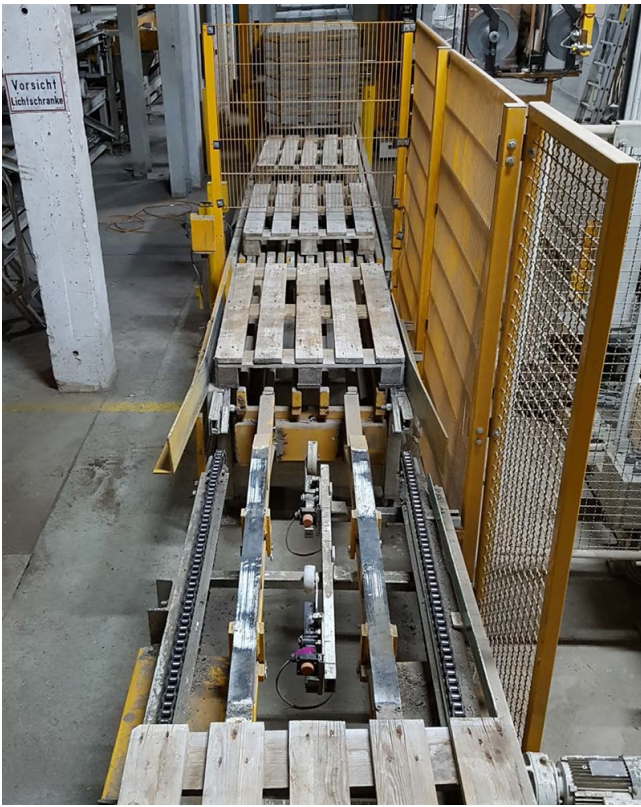
Übersicht des Palettenwegs in die Anlage