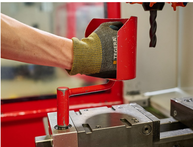
Die Handkurbel im Einsatz.