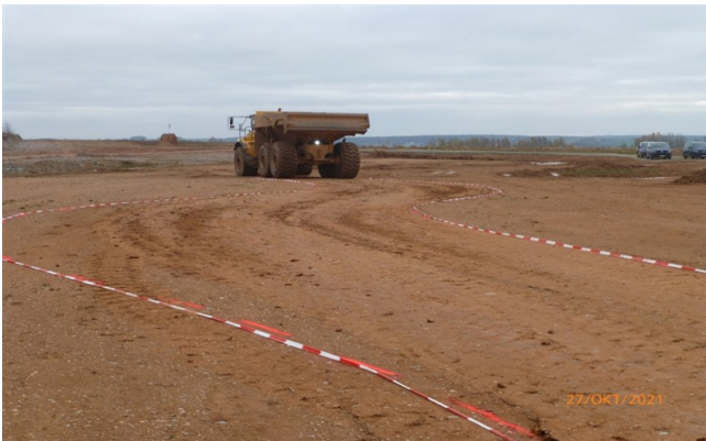
Rückwärtsfahren in einer S-Kurve