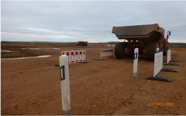
Rückwärtsfahren und punktgenaues Anhalten