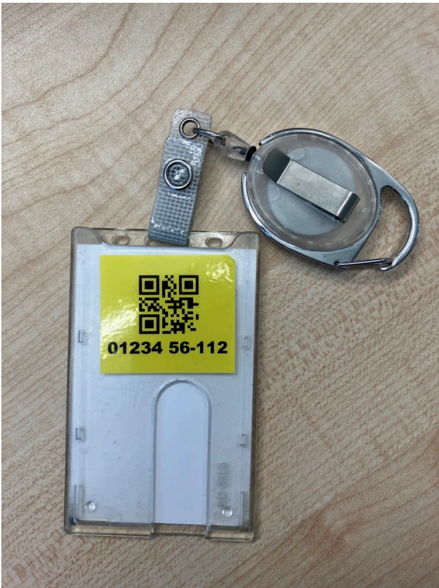
Ausweis: QR Code auf Mitarbeiterausweis