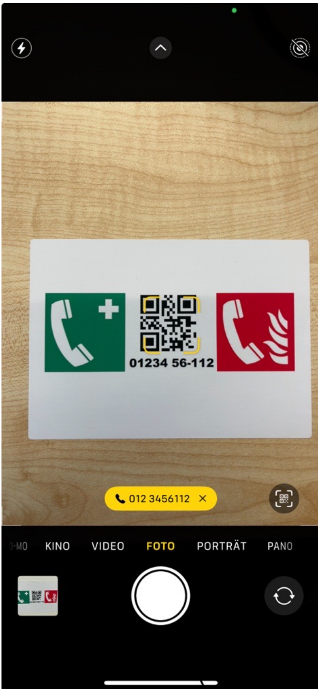
Wählen: Screenshot vom Wählen durch Abscannen des QR Codes