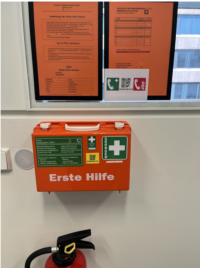
Erste-Hilfe-Station: QR Code in 2 Varianten auf Ersthelferliste und Ersthilfekasten