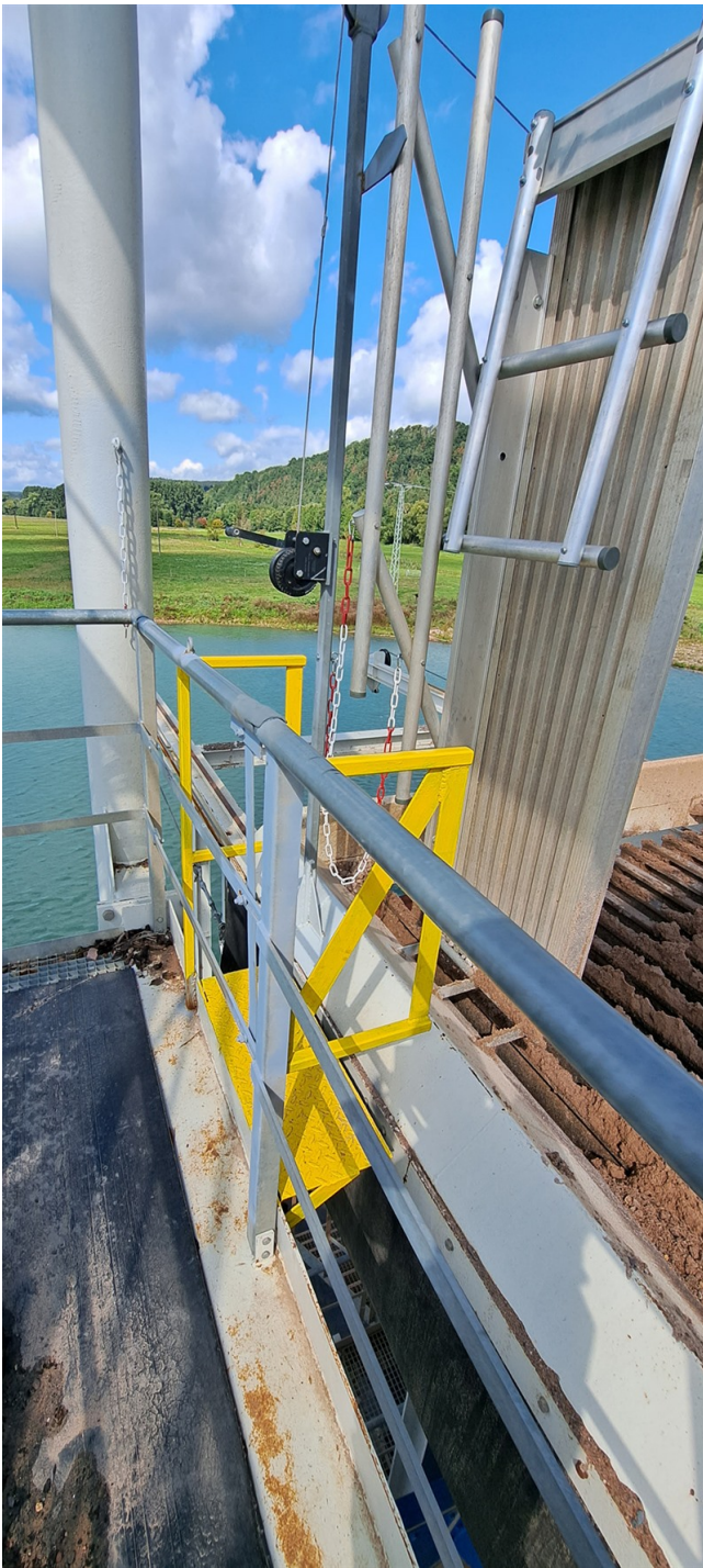
Bewegliche Arbeitsbühne stehend