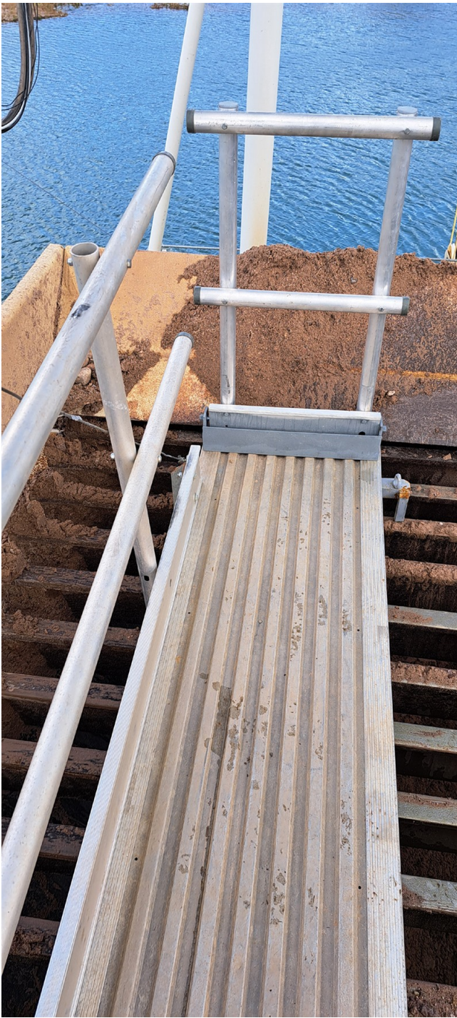
Bewegliche Arbeitsbühne liegend