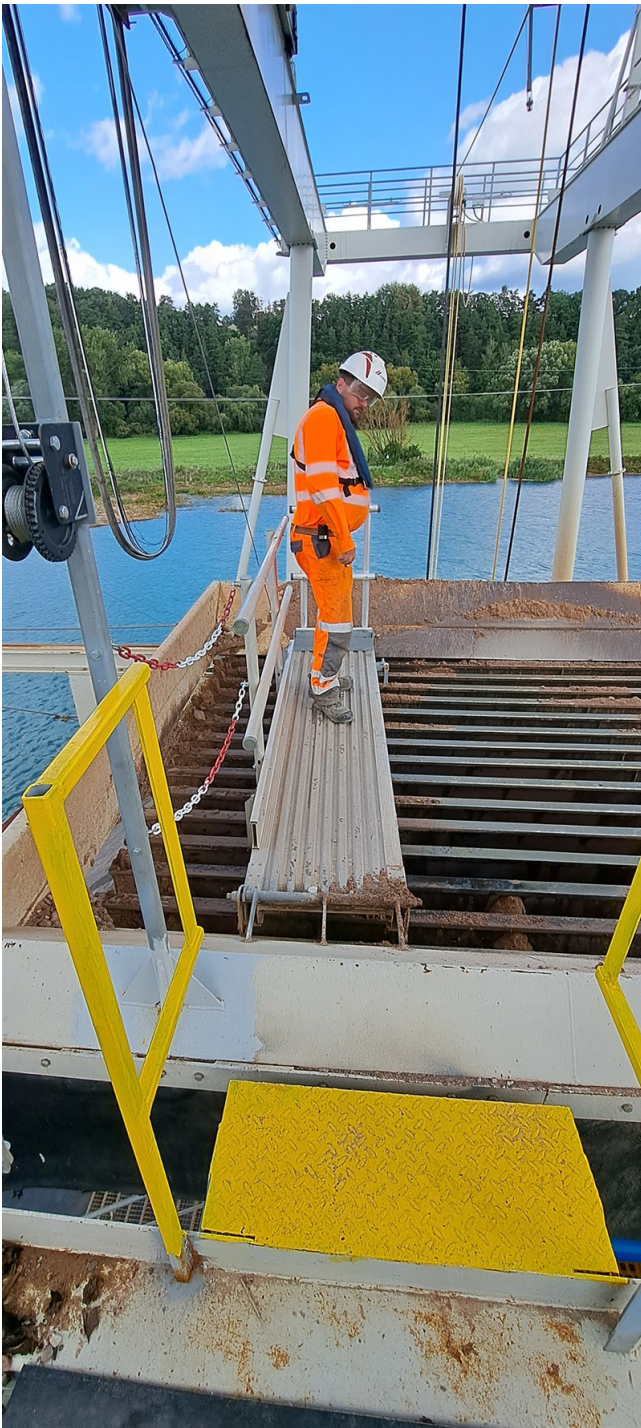
Zugang zur Arbeitsbühne